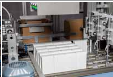
» Groupage produits