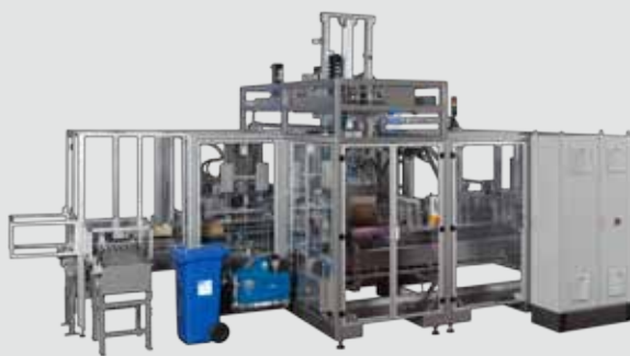
Plan d'ensemble oli 210 V

Remarque: les machines d'emballage oli sont personnalisées en termes de cadence, de couleur, de charge installée, etc., pour répondre à l'application spécifique du client. Toutes les machines peuvent être conçues en fonction de chaque format.