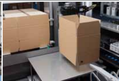
» Mise en forme de la caisse