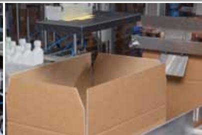
» Dispositif de fermeture du rabat inférieur