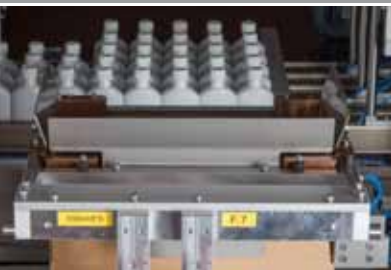
» Alimentation en produits / trémie